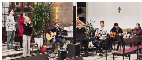
Doprovod k Večeru chval 22. října